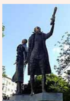
Willem van Oranje zoals hij sinds kort in Antwerpen te zien is in brons.