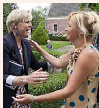
Prinses Laurentien begroet Yvon Jaspers in Loenen, bij de presentatie van het kinderboek 'Ties en Trijntje'.