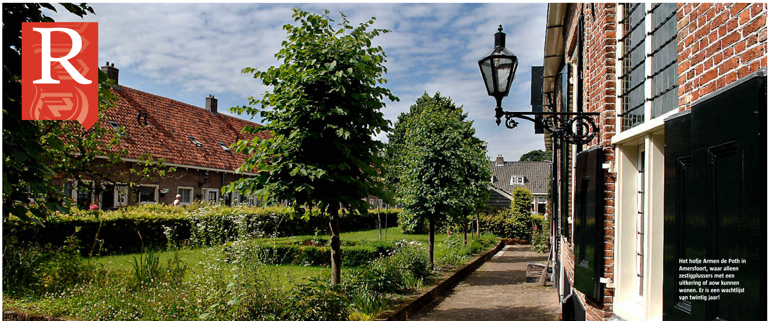
Het hofje Armen de Poth in Amersfoort, waar alleen zestigplussers met een uitkering of aow kunnen wonen. Er is een wachtlijst van twintig jaar!